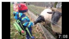
Semínko země 7:08