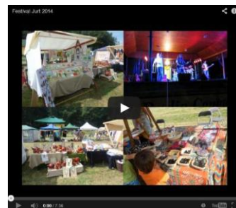
.. kapela ČESKÉ SRDCE

https://www.youtube.com/watch?v=bn0XaeG1dpQ#t=445