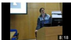
Ochrana Klokočských skal 8:18