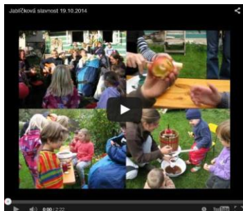
Jablíčková slavnost 19.10.2014

Tradiční jablíčková slavnost je takový "pracovní" Den stromů. Semínko země ve spolupráci s CPR M.E.D., dopolední kutění (loutečky, tisk pytlíčků a odpolední moštování a Jablíčkové dobrůtky).