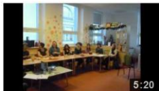
Síť mateřských center 5:20

Videa: Kamera na kolečkách http://k-n-k.webnode.cz/sladujeme/